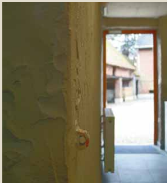
Afwerkingsbedrijf en houder van een VIBE-label met drie sterren Tintelijn, zorgt voor lagen natuurverf, tadelakt en leem.

Voor rolstoelgebruikers voorzien de geranten speciale paadjes, een apart (uitklapbaar!) wc-hokje en een